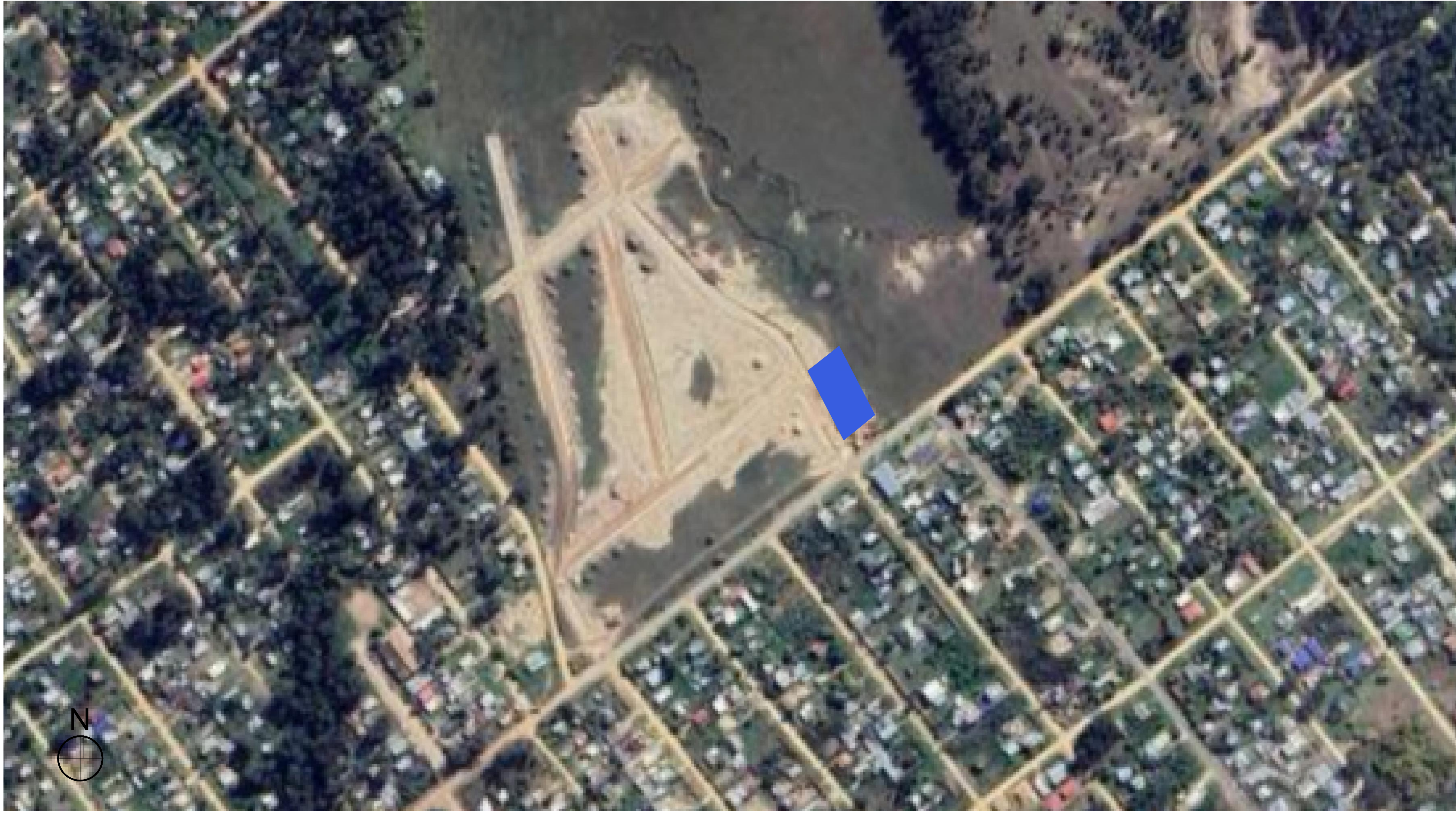
IMPLANTACIÓN EN EL PADRÓN ESC 1_1500