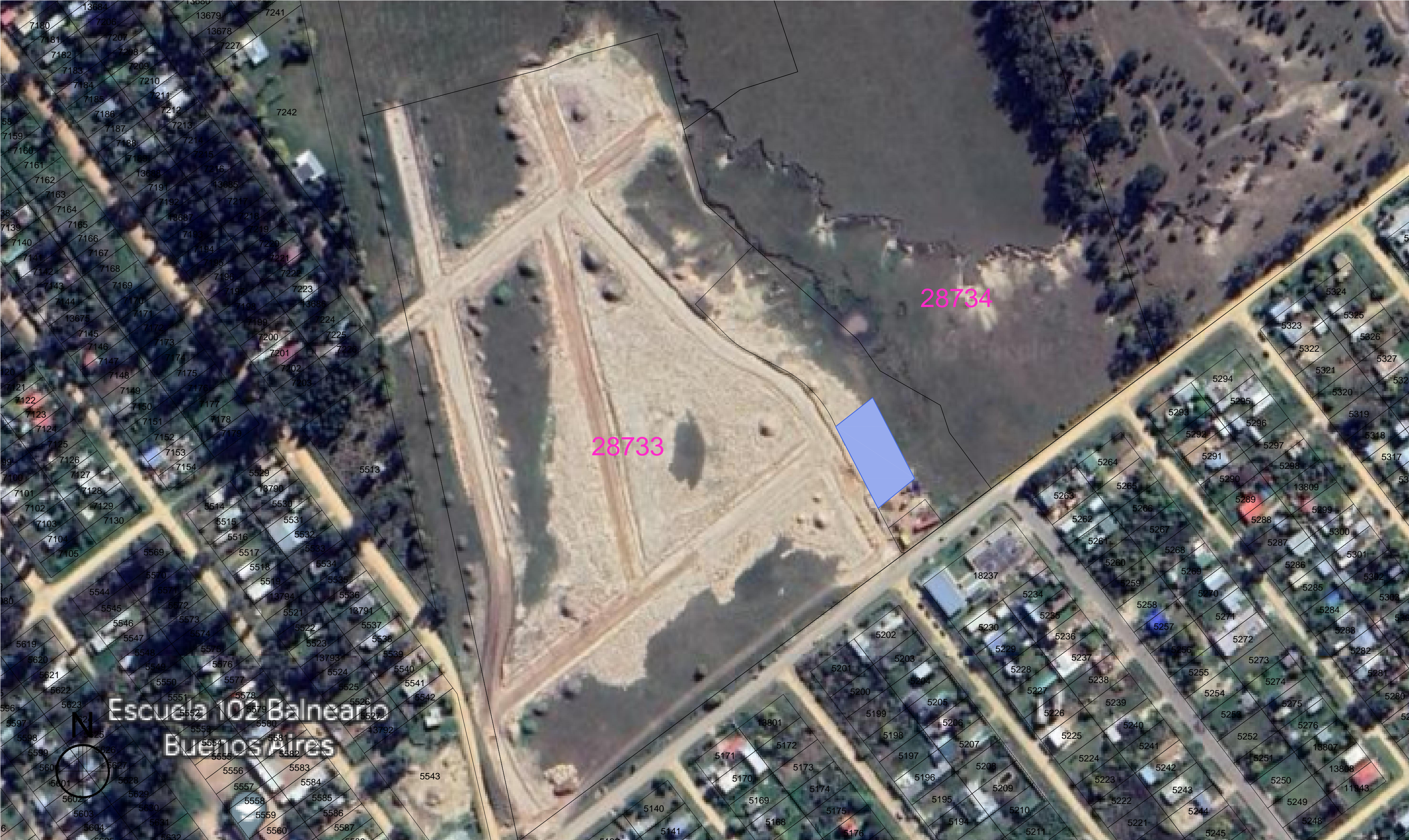
GRÁFICO ESC 1_1500