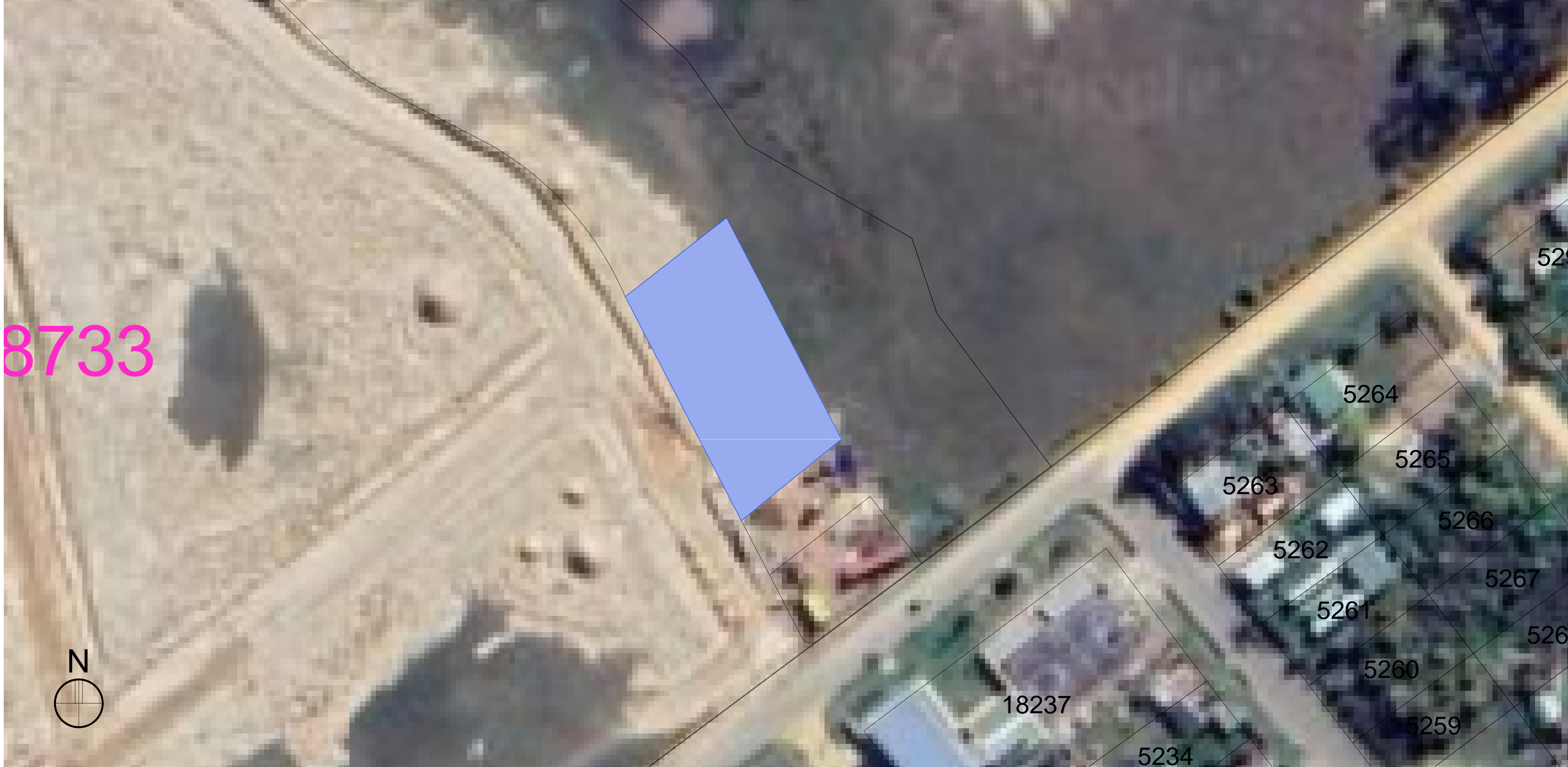
IMPLANTACIÓN EN EL PADRÓN ESC 1_500